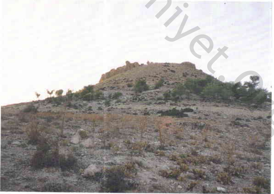
Resim 2 — Râvendân kalesinin Belenözü köyünden görünüşü