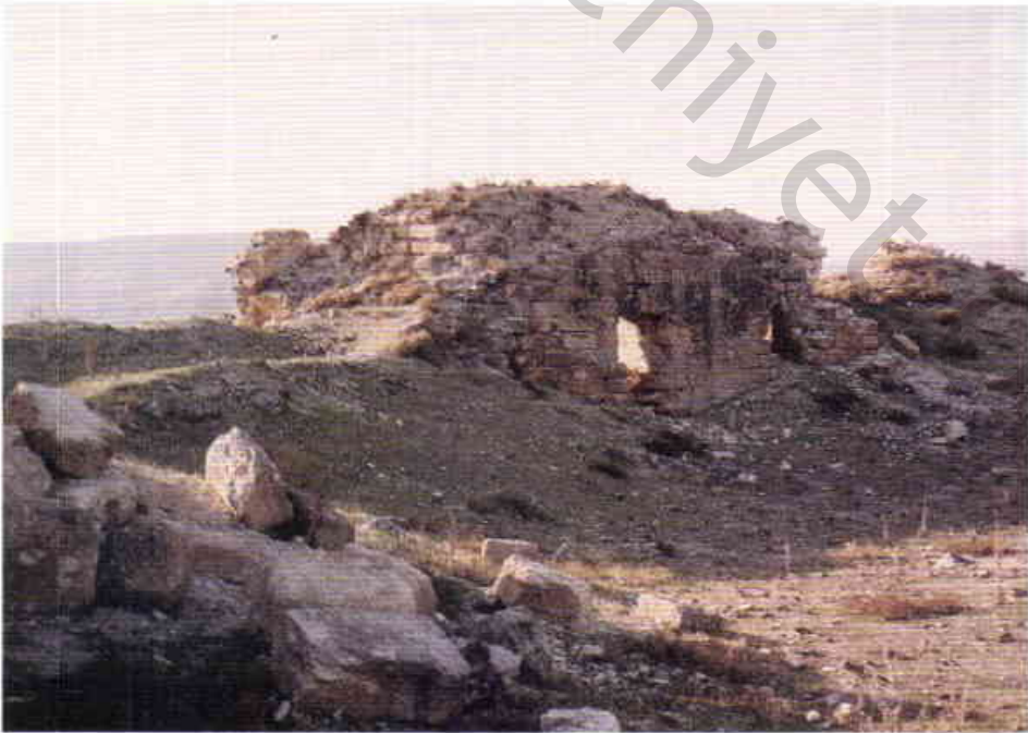
Resim 8 — Kale içinde bina kalıntısı