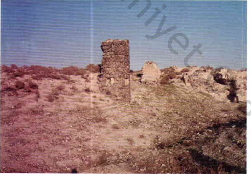
Resim 10 — Kale surlarında burc kalıntısı