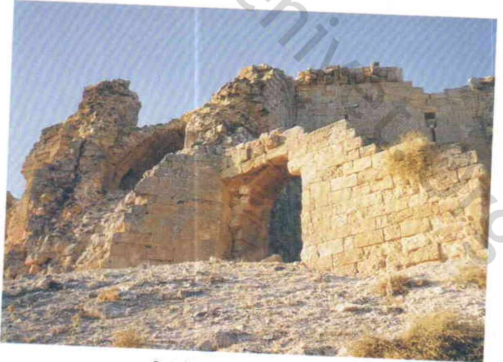
Resim 6 — Giriş kapısından görüntü