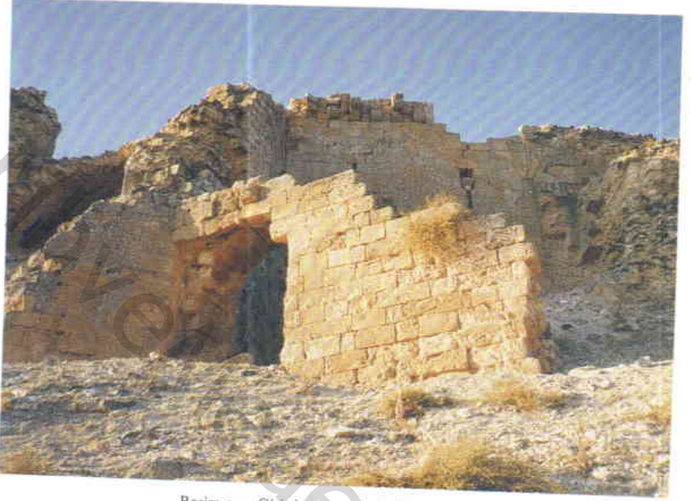
Resim 5 — Giriş kapısının başka bir görünüşü