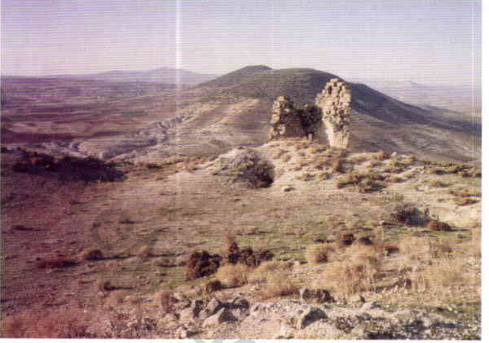
Resim 9 — Kalede bir burc kalıntısı