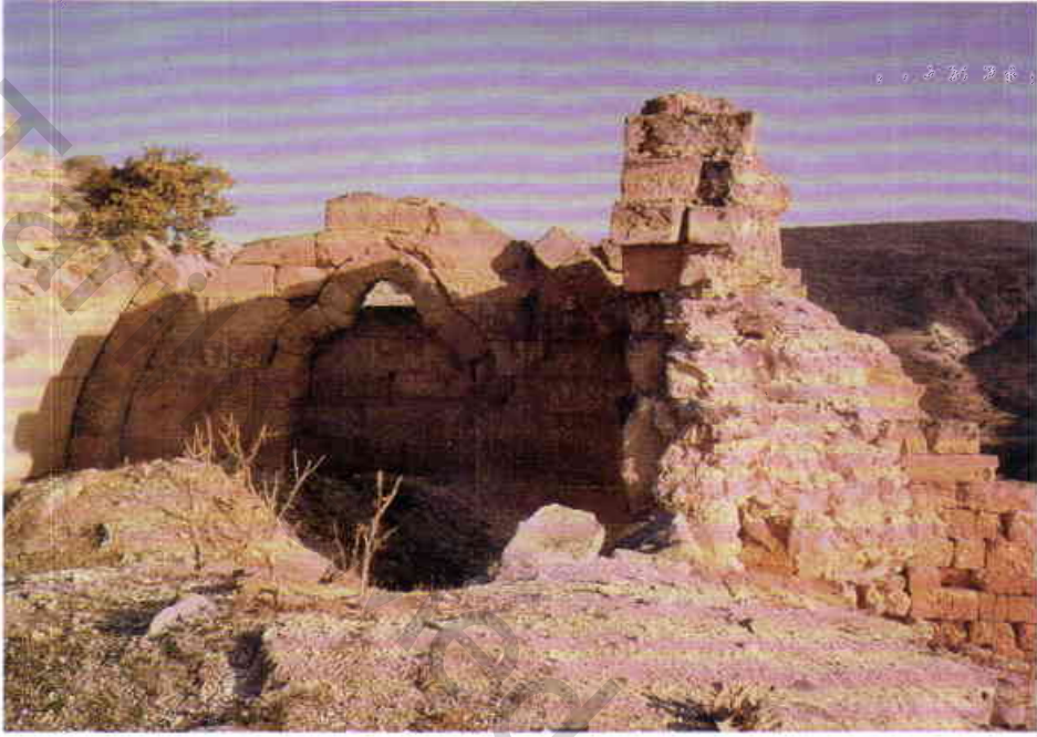
Resim 7 — Kale içinde bina kalıntısı