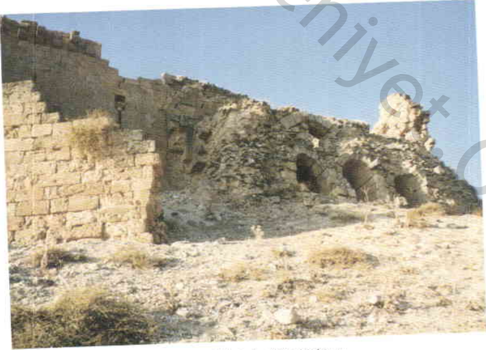
Resim 4 — Kalenin üç gözlü giriş kapısı