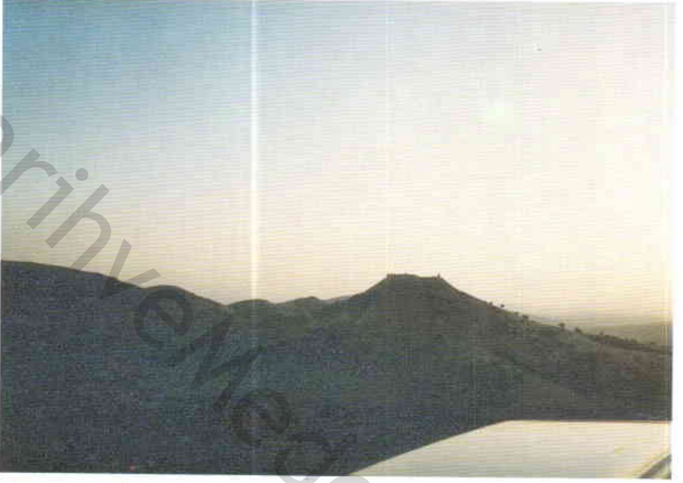
Resim 1 — Râvendân kalesinin yoldan görünüşü