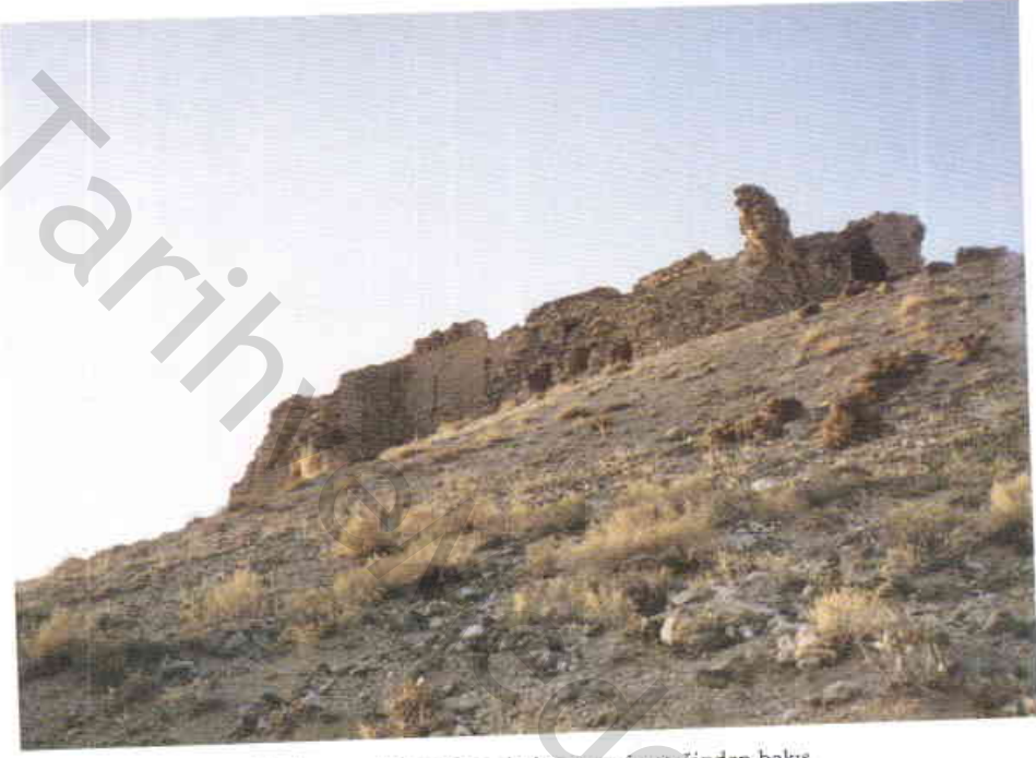
Resim 3 — Râvendân kalesine tepenin eteğinden bakış